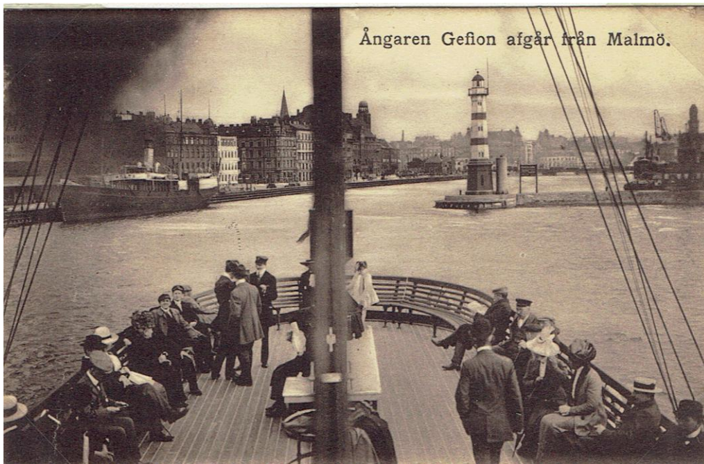
Gefion i Malmö hamn 1903.

Som tur var så fanns denna dag bara omkring 30 personer ombord. Det fanns dock ingen tid att rädda bagage, inventarier eller posten. Redan dagen efter så hämtade dykare upp bagaget och posten.